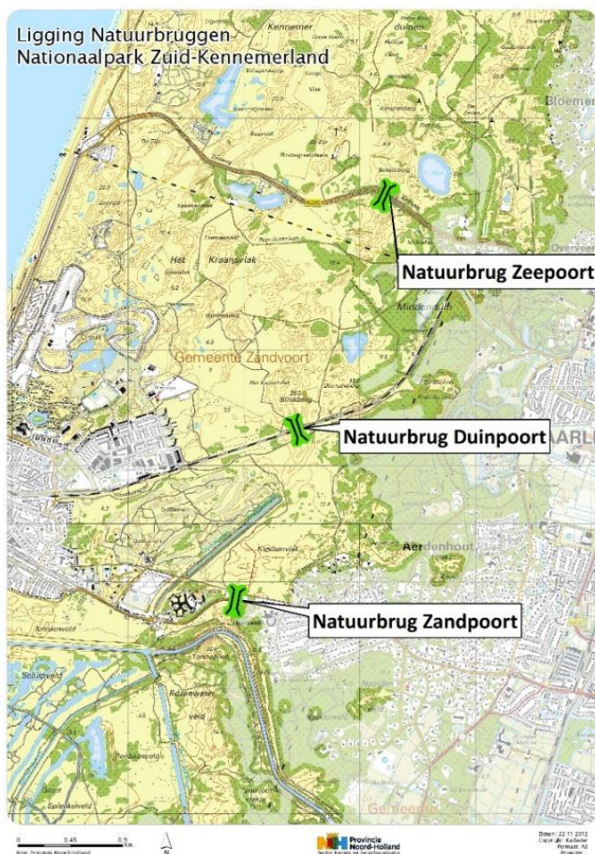
Figuur 1. Overzicht van de ligging van een drietal natuurbruggen die de afgelopen jaren zijn gerealiseerd binnen het leefgebied van de damherten in de AWD en het NPZK. (Op basis van bronkaart van Provincie Noord-Holland).

Wanneer op termijn ook natuurbrug Zandpoort wordt geopend, ontstaat er weer een vrije mogelijkheid tot migratie van damherten tussen AWD en NPZK. Dit betekent echter niet per definitie dat migranten in hun nieuwe populatie ook voor nageslacht weten te zorgen en genetische menging tussen de beide populaties daarmee ook effectief optreedt. Recent onderzoek aan edelherten op de Veluwe lijkt er bijvoorbeeld op te wijzen dat daar weliswaar migratie tussen deelgebieden optreedt, maar dat per deelgebied sprake is van meerdere bloedgroepen, doordat dieren met een gelijke genetische afkomst bovengemiddeld vaak met elkaar paren (De Groot et al. 2016).