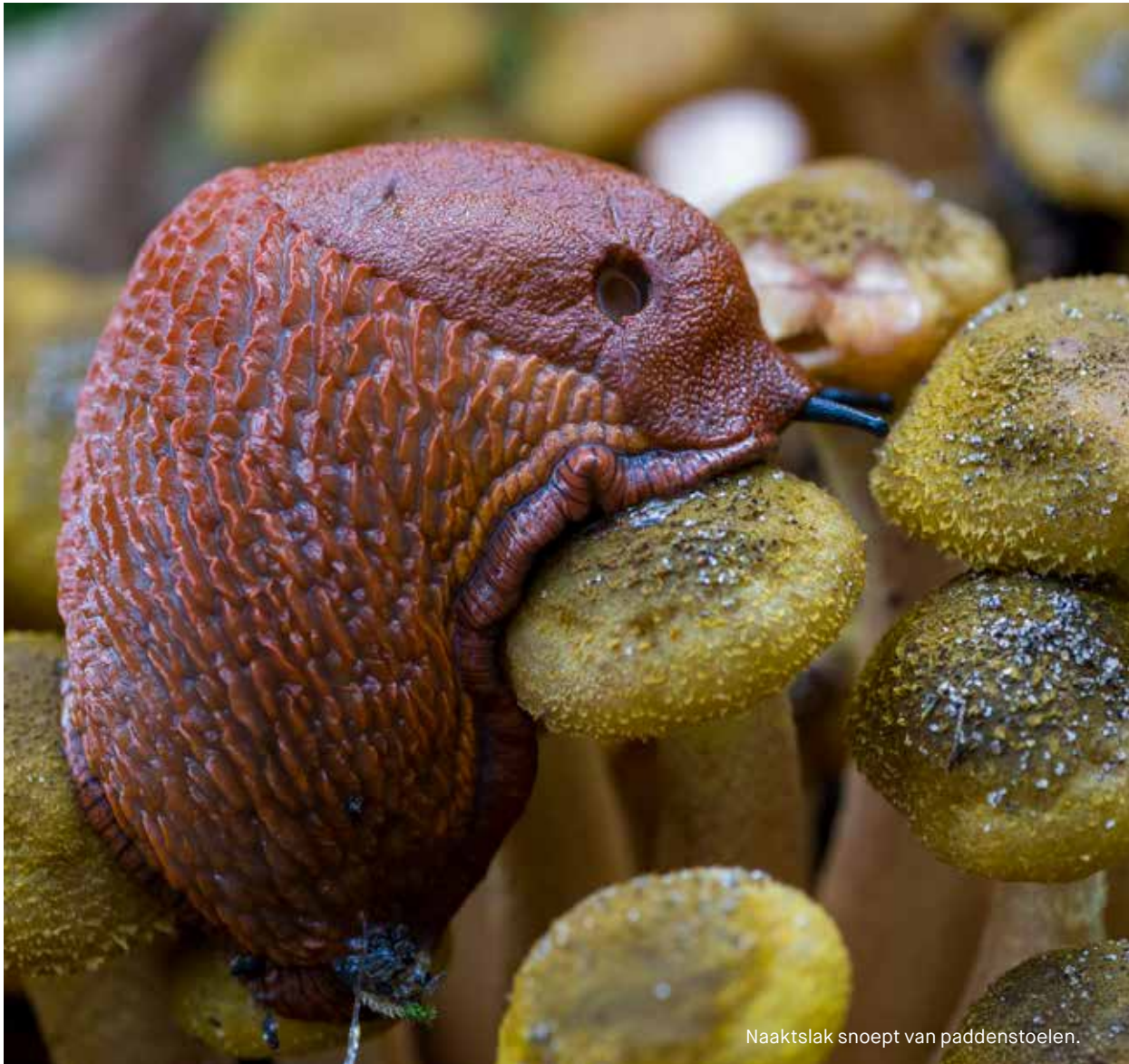
Naaktslak snoept van paddenstoelen.