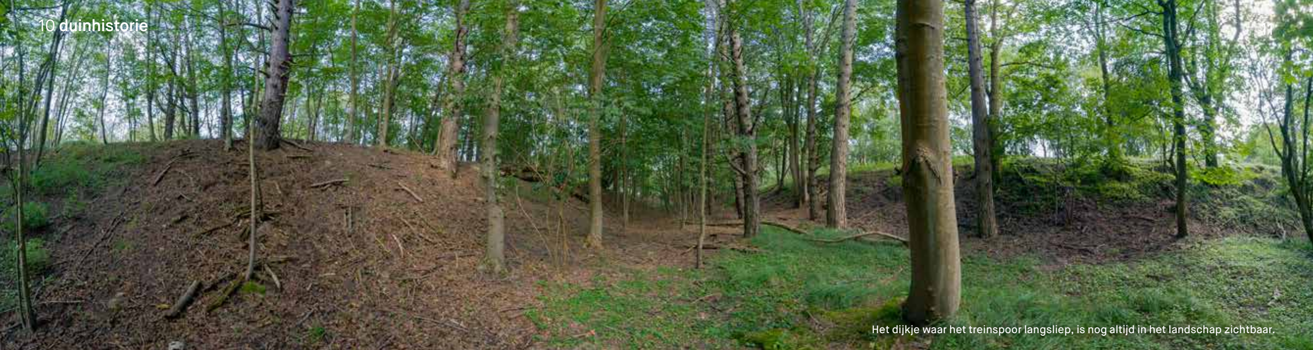
Het dijkje waar het spoor langsliep, is nog altijd in het landschap zichtbaar.