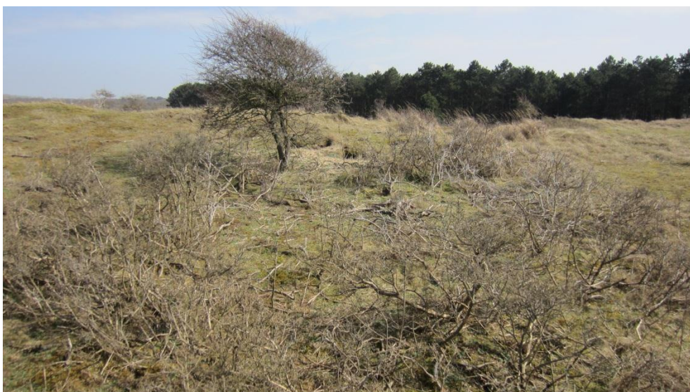
Foto 4: Afgestorven struweel van duindoorn en liguster. Meidoorn resteert als solitair boompje. Waarschijnlijk spelen damherten hier een ondergeschikte rol.