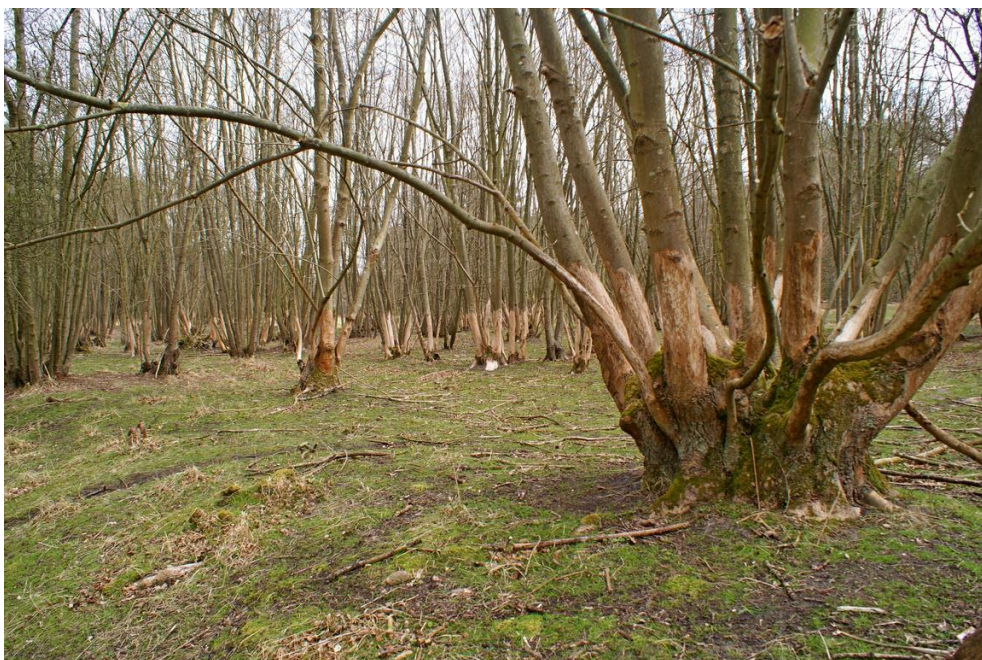
Foto 3: Oud essenhakhout dat door damherten is geschild. Ook het ontbreken van ondergroei is duidelijk te zien