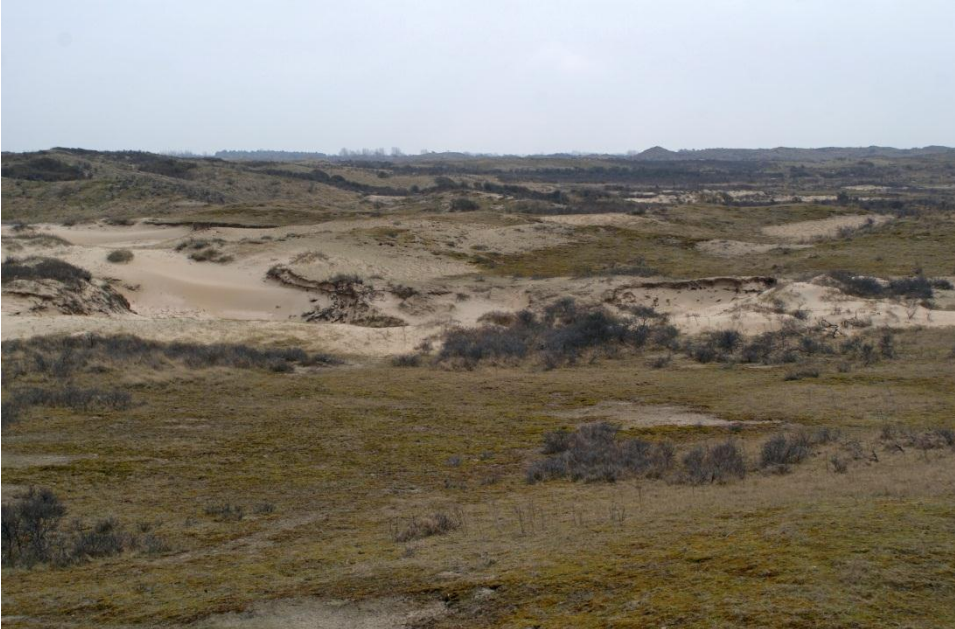
Foto 1: Grijs duin in goede staat van instandhouding: kleinschalige dynamiek is volop aanwezig en de korte grasmat wijst op voldoende begrazing (zeeduinen AWD).

Bij afwezigheid of lage dichtheden van konijnen kunnen andere herbivoren (runderen, paarden, schapen en ook damherten) de grazende rol van konijnen deels overnemen. Deze grote grazers hebben in principe allemaal hun eigen graasgedrag en een specifieke 'niche'. Een belangrijk verschil met konijnen is wel dat grote grazers weinig of niet bijdragen aan de zanddynamiek van het duinsysteem.