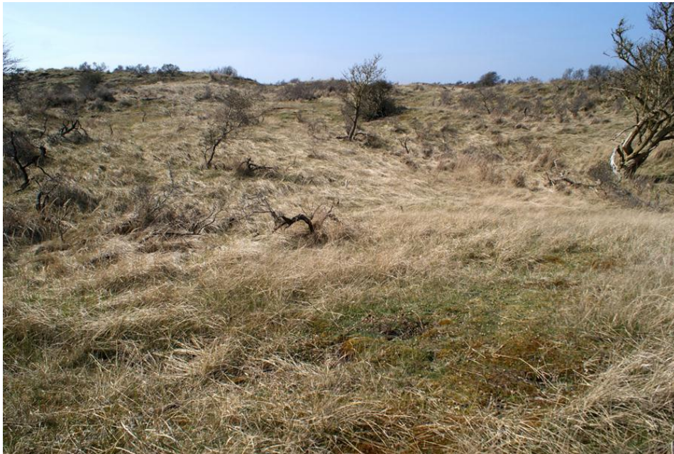
Foto 2: Grijs duin in vergraste staat: zanddynamiek is afwezig en de grasmat is sterk onderbegaasd (middenduinen AWD).